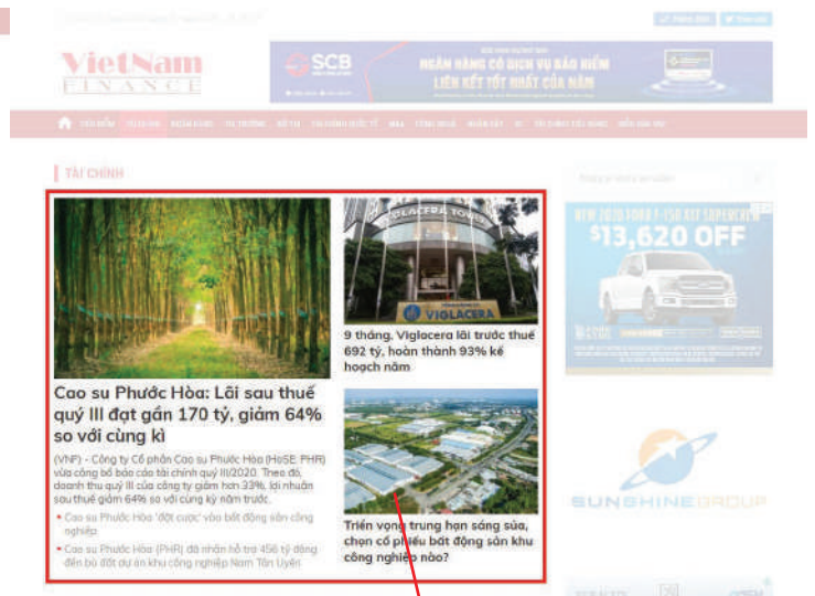
PR LOẠI 2 (Trang chuyên mục)