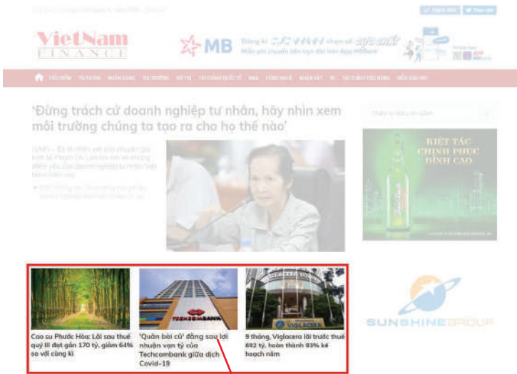
PR LOẠI 1 (Trang chủ)