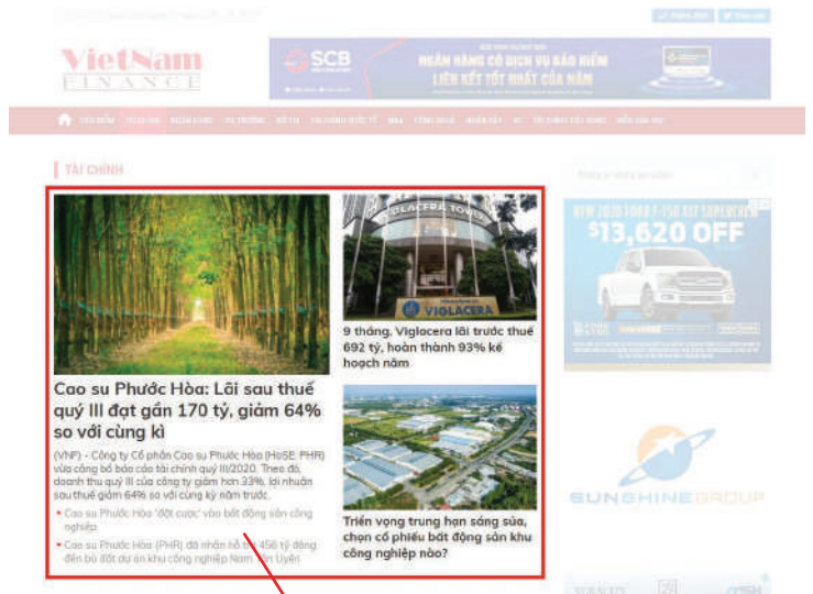
PR LOẠI 1 (Trang chuyên mục)