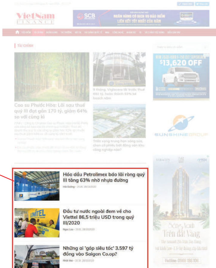
PR LOẠI 4 (Trang chuyên mục)